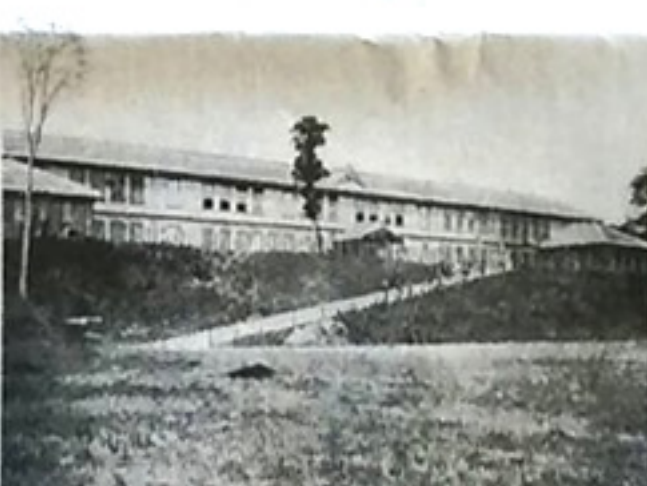
1901(明治34)年、現在の小田原駅の地に落成した初代校舎

1901(明治34)年に開校した小田原の初代校舎は現在の小田原駅の場所にあった。当時の校地を今の地図に重ね合わせると、東口の駅前広場から西口に、東海道線の線路をまたぐように運動場が、その東京寄りに校舎があったことが分かる。「小田原高校百年の歩み」に「小高い丘の上に踏え立ち、櫻、榎など、うっそうとした大木が取り巻いていた。丘の南面には大運動場が広がり、三」と当時の様子が記されている。1日平均の乗車人員が約10万人という今の小田原駅のそばに